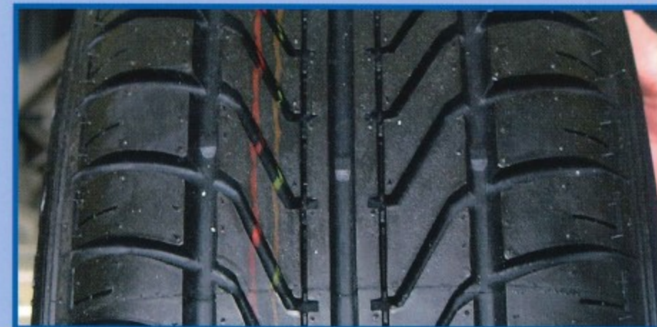
De TWI indicator: goed