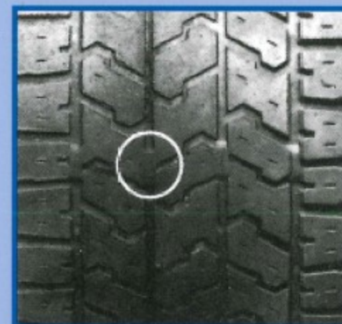
De TWI indicator (1,6 mm): versleten